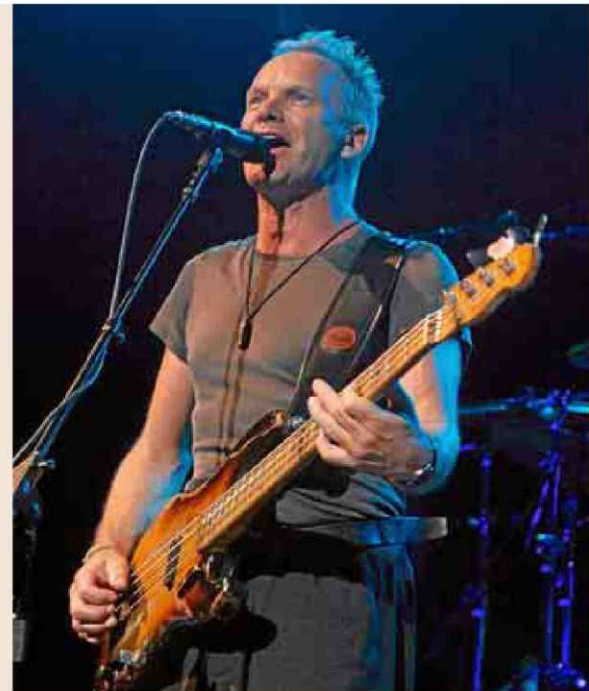
Sting es conocido por tutelar a sus colaboradores como un padre.

Otra de las materias en las que el rock es un ejemplo que se debe seguir es la creatividad. Las composiciones o los espectáculos son una expresión constante de innovación. Pa-